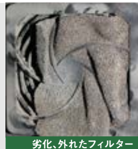
劣化、外れたフィルター