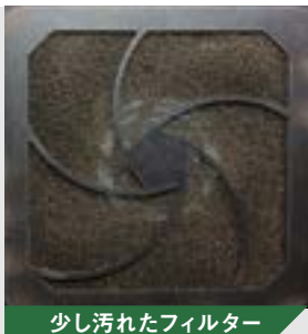
少し汚れたフィルター