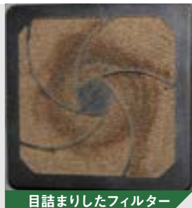
目詰まりしたフィルター