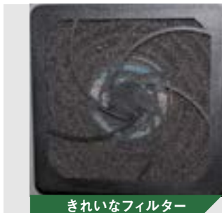
きれいなフィルター